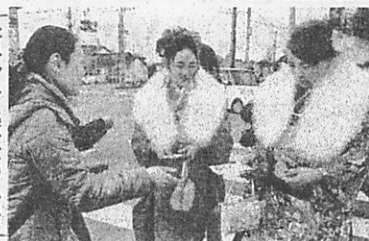
憲法の小冊子新成人に配布はらまち九条の会南相馬市の「はらま